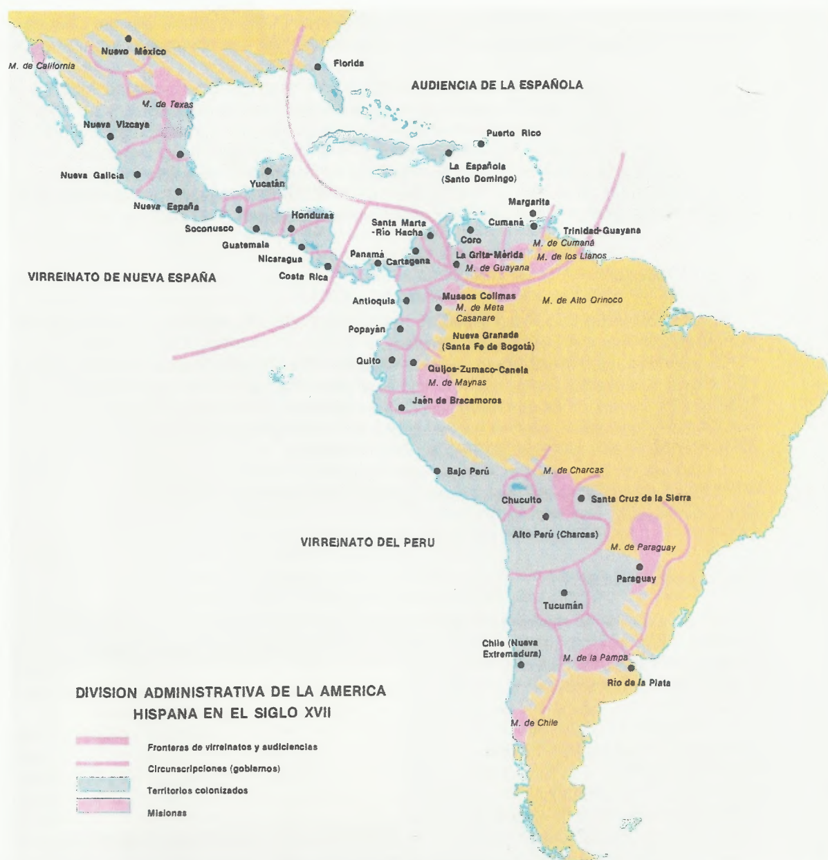
Den administrative opdeling af spansk Amerika i 1600tallet.

I stedet for indianere begyndte man at importere negere til slavearbejdet. Carl II manglede penge og tjente blandt andet på at gøre slavehandel til et royalt monopol. Han udliciterede opgaven til flamske, tyske, hollandske og portugisiske slavehandlere, som indkøbte negerne på Afrikas vestkyst. Primært blev slaverne hentet til Antillerne og Nueva Granada (Colombia). Det var områder med varmt klima som i Guinea og med landbrugsarbejde der krævede fysisk styrke. Først og fremmest var det dyrkning af bomuld og sukker den importerede arbejdskraft skulle bruges til.